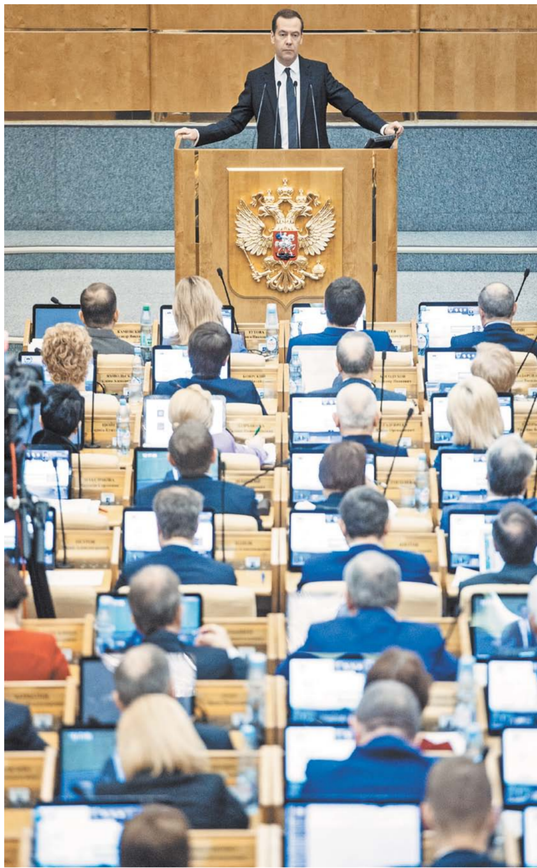
Нынешний отчет перед депутатами Госдумы был пятым по счету для Дмитрия Медведева.

Главным политическим событием ушедшего года Медведев назвал выборы в Госдуму. Ведь единый день голосования определил стратегический курс России на ближайший политический цикл. «Выборы в Думу показали, что важнее всего в работе власти для граждан — последовательность и ответственность за принимаемые решения, способность слышать их проблемы и выполнять обещания», — оценил глава правительства. Он уверен, что в ходе предстоящих президентских выборов люди опять же проголосуют за стабильность и развитие. «Борьба как в любой президентской гонке будет серьезной. Но мы с вами никогда не превращали политическую борьбу в войну и делать этого не будем», — заявил Медведев.