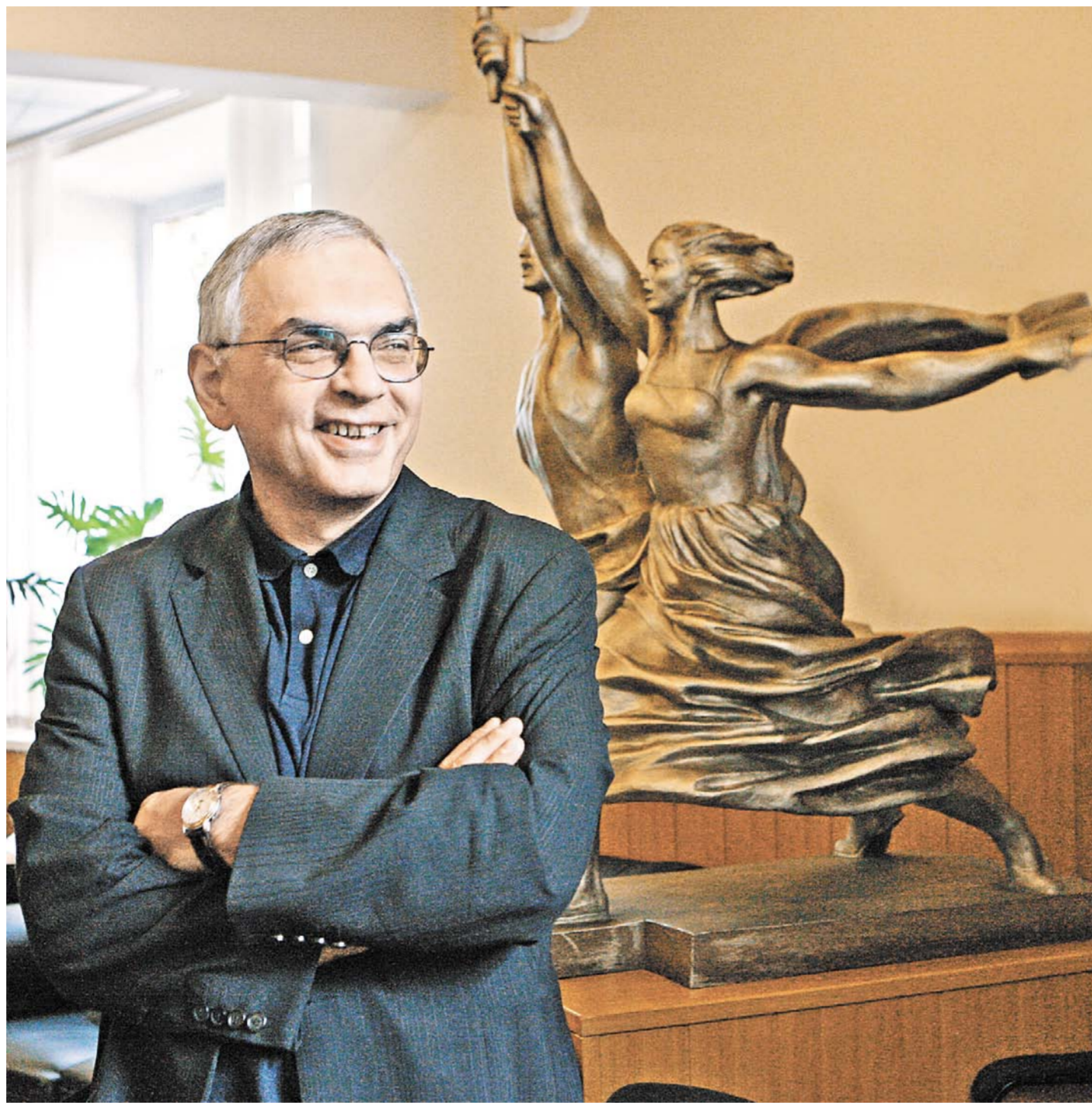
Карен Шахназаров: Нашей киноотрасли нужна эффективная организация.

Карен Георгиевич, вы не раз высказывали мысль, что нам необходимо вернуть Госкино. Что именно вы имеете в виду? Какими функциями должна быть наделена эта организация? КАРЕН ШАХНАЗАРОВ: Слово «Госкино» не надо понимать буквально. Я имел в виду, что организация киноотрасли в России не совершенна. Нам прежде всего нужен единый центр управления, а уж как он будет назван — дело третье. Просто функции у него должны быть схожи с теми, что были у Госкино в СССР. Ведь советская система кинопроизводства при всех ее минусах была эффективной. Прежде всего благодаря тому, что была централизованной и занималась всеми проблемами кино, начиная от финансирования и отбора проектов и заканчивая вопросами технологий, развитием которых у нас сегодня вообще никто не занимается.